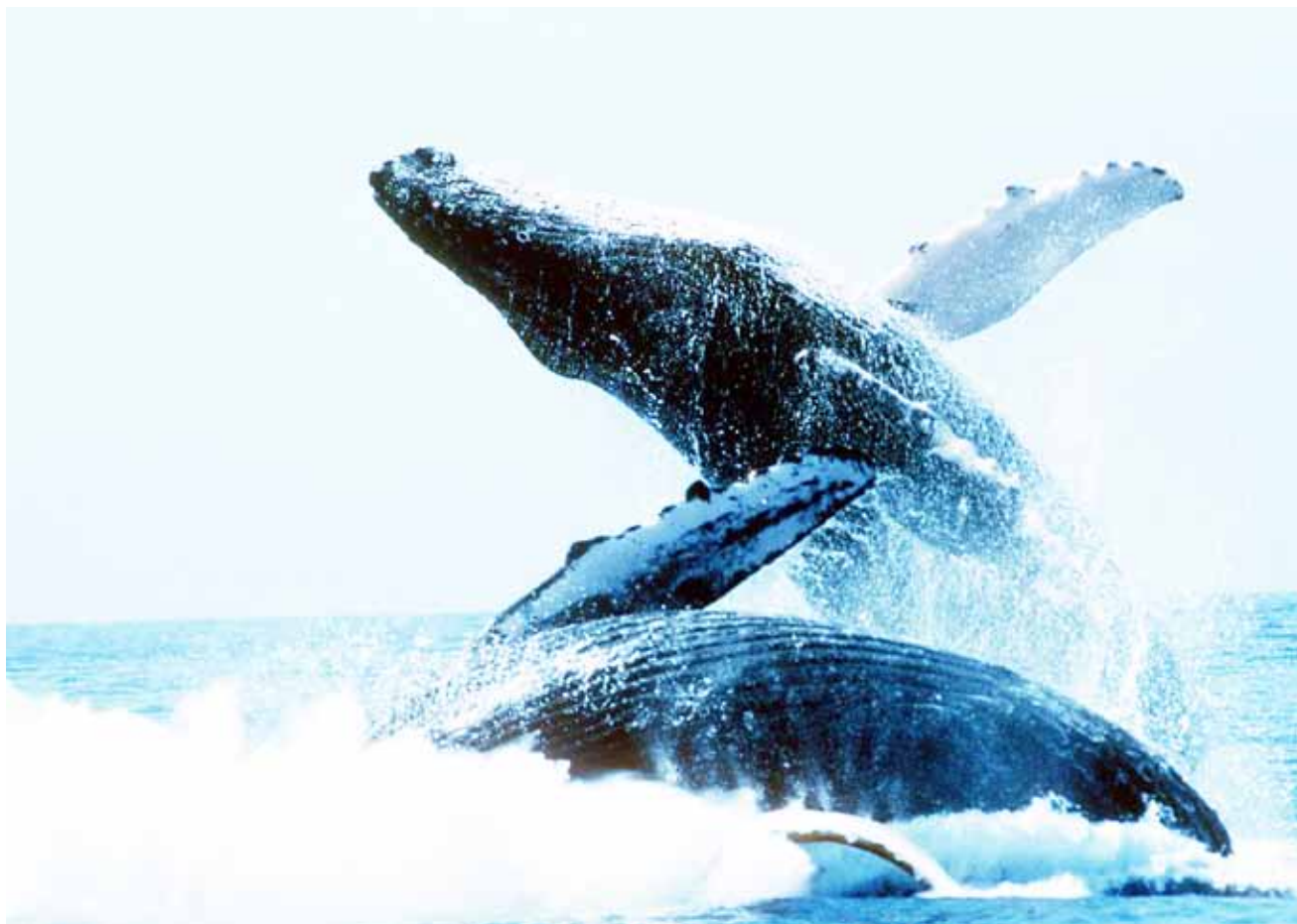
Las ballenas montan un excelente espectáculo en Samaná.

Las ballenas Jorobadas aprovechan las aguas cálidas de la costa norte del país para enamorarse, aparearse, parir y amamantar a sus crías que mide al nacer entre 12 y 13 pies y pesa entre 2,000 y 3,000 libras.