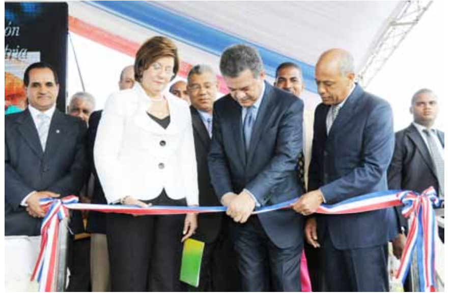
Presidente Leonel Fernández mientras corta la cinta para dejar inaugurado el plantel escolar.

La ministra de Educación informó que en la provincia Sánchez Ramírez el gobierno construye actualmente los planteles El Jibe, en el Cruce de Maguaca; el liceo Los Limoncitos, en Fantino; el liceo Hernando Alonso, en Los Corozos,