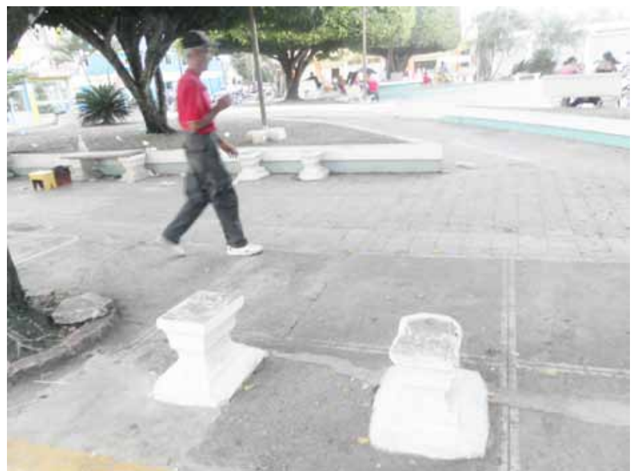
La falta de bancos es evidente en el parque de Fantino.

Manifiestó que esa succión de recursos, por esas vías, es lo que explica que la gente común no sienta el dinero circulando en las calles, a pesar del cacareado crecimiento de la economía en base a préstamos internacionales que crecen vertiginosamente.