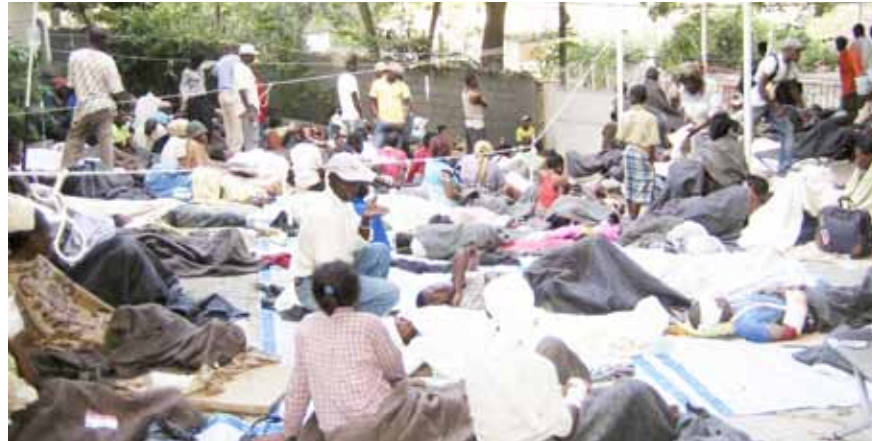
La CIDH dijo que está a disposición de las autoridades haitianas y de la comunidad internacional para colaborar, dentro del marco de sus funciones, con las iniciativas desplegadas con miras a superar la situación crítica que vive la población de dicho Estado miembro de la Organización.

de Naciones Unidas para Haití, el porcentaje de niños con malnutrición crónica llega a 31 por ciento en algunos departamentos del país, casi la mitad de la población no tiene acceso a agua potable, y no hay un sistema de saneamiento en funcionamiento en ninguna ciudad del país.