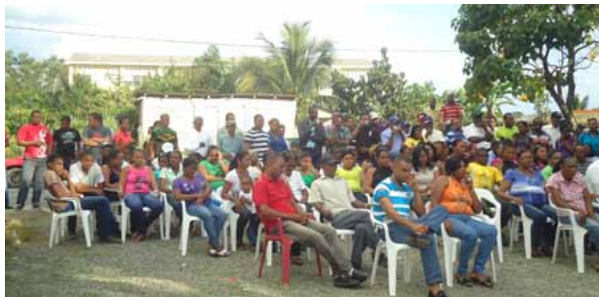
Parte de los comunitarios que asistieron a la reunión en El Limpio, Zambrana.