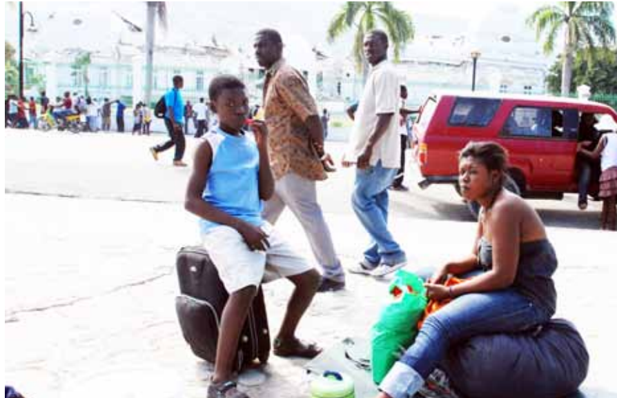
Haitianos en la ciudad de Dajabón.

Luego de las festividades de navidad y año nuevo una gran cantidad de ilegales haitianos han tratado de penetrar a la República Dominicana, para dedicarse a las actividades de producción y la construcción.